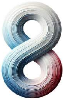
IAS VERSION 8