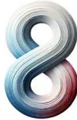
IAS VERSION 8